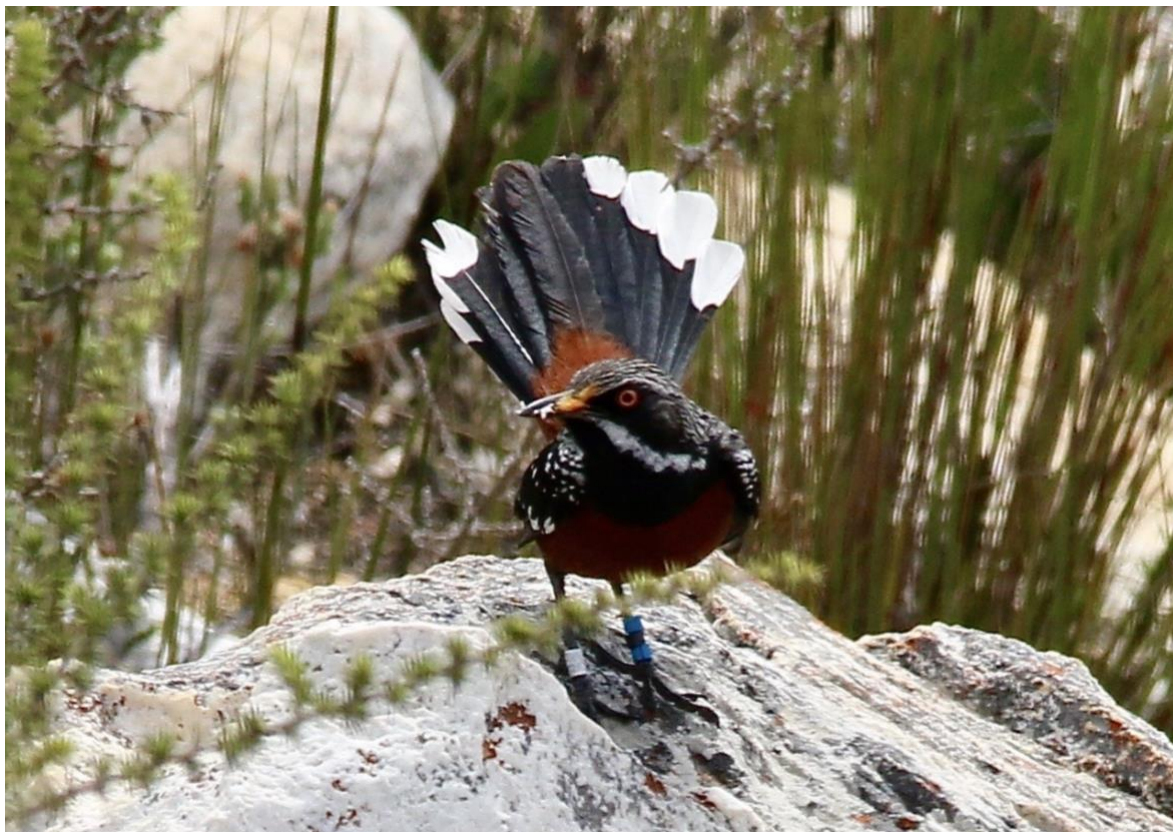
Foto 2. Volwanne wyfie Kaapse Berglyster